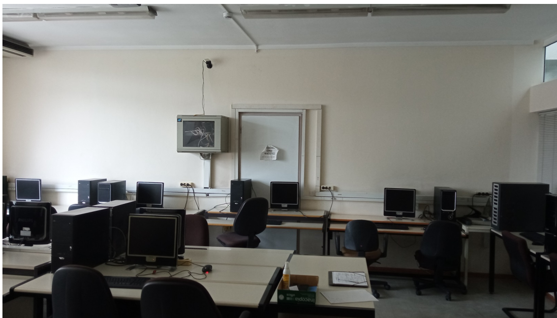
Εικόνα 1: Άποψη του Εργαστηρίου 533 ΓΔ, όπου φαίνεται ο τοίχος με τον οποίο διαχωρίζεται με το 534

Στον 5 ο όροφο του Πύργου ΓΔ βρίσκονται οι χώροι Εργαστηρίων 533 και 534 του Τμ. Εφαρμοσμένης Πληροφορικής. Τα εργαστήρια διαχωρίζονται μεταξύ τους με τοιχοποιία, ενώ εντός του 533 υπάρχει ξεχωριστός χώρος γραφείου, επίσης διαμορφωμένος με τοιχοποιία.