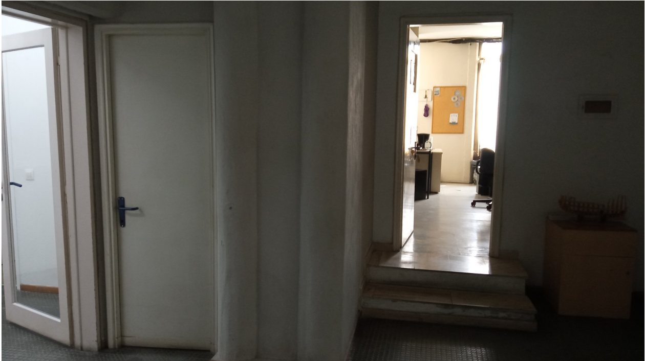
Εικόνα 3: Άποψη της εισόδου του Εργαστηρίου 532 ΓΔ

Κατόπιν αιτήματος του Τμ. Εφηρμοσμένης Πληροφορικής προβλέπεται να εκτελεστούν εργασίες ανακαίνισης και μικρής επέκτασης προς τον κοινόχρηστο χώρο, ώστε να αυξηθεί η ωφέλιμη επιφάνεια του εργαστηρίου. Συγκεκριμένα προβλέπεται, μεταξύ άλλων: