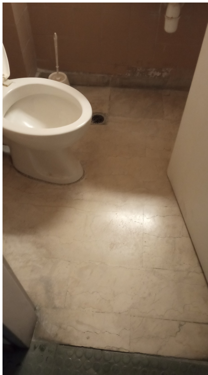
Εικόνα 6: Άποψη του wc 229 ΚΖ