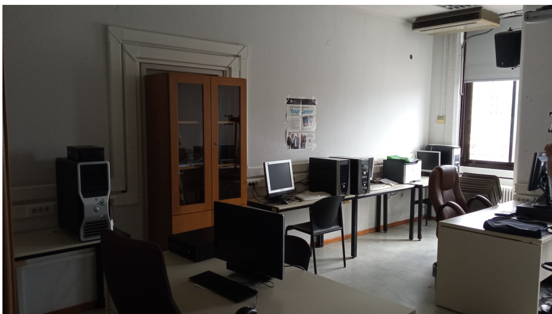
Εικόνα 2: Άποψη του Εργαστηρίου 534 ΓΔ, όπου φαίνεται ο τοίχος με τον οποίο διαχωρίζεται με το 533

Με το Πρακτικό υπ' αριθμ. 6/11-04-2019 της Συνεδρίασης της Κοσμητείας Σχολής Επιστημών Πληροφορίας αποφασίστηκε ομόφωνα η ενοποίηση των εργαστηριακών χώρων 533 και 534 με