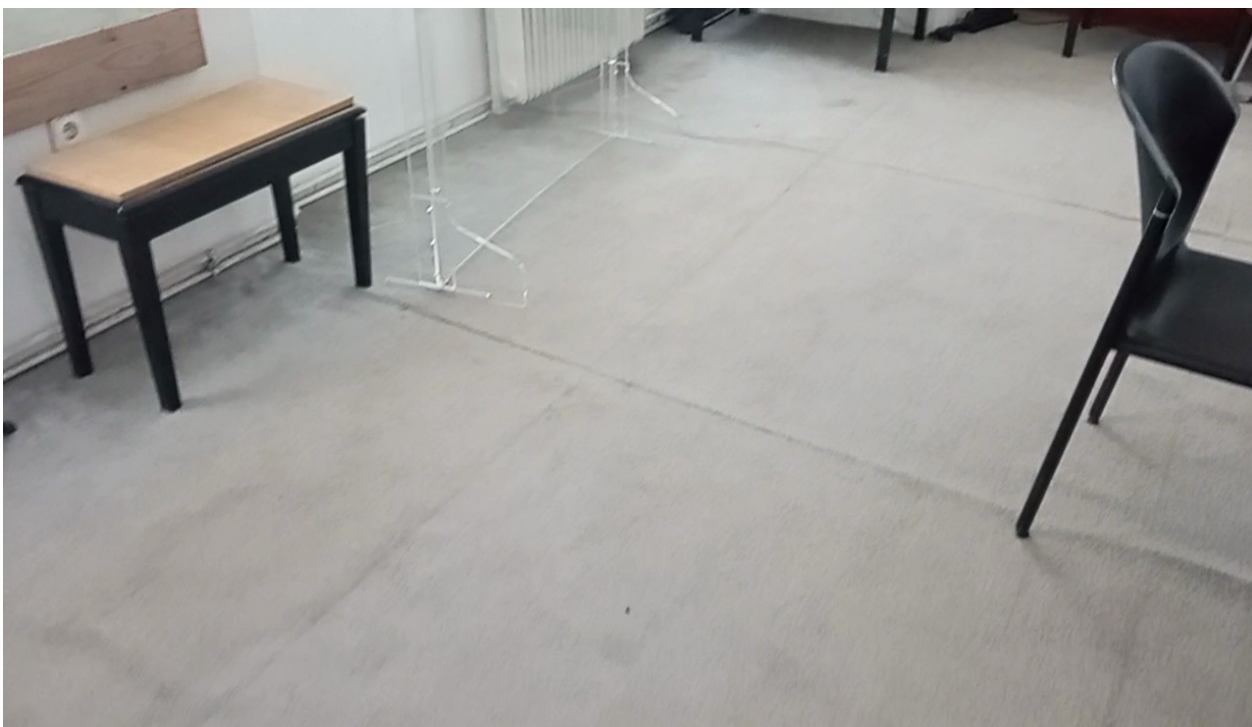
Εικόνα 5: Άποψη της φθαρμένης μοκέτας στο γραφείο 401 ΚΖ

Τα γραφεία 401Α και 401Β του Τμ. Επιστήμης και Τέχνης στον 4ο όροφο του Πύργου ΚΖ διαμορφώνονται ομοίως με τα γραφεία 212Α-212Β και 312Α-312Β, δηλαδή καθαιρούνται τα Έργο: Διαρρυθμίσεις (αρ. μελ. Ε02/2021)