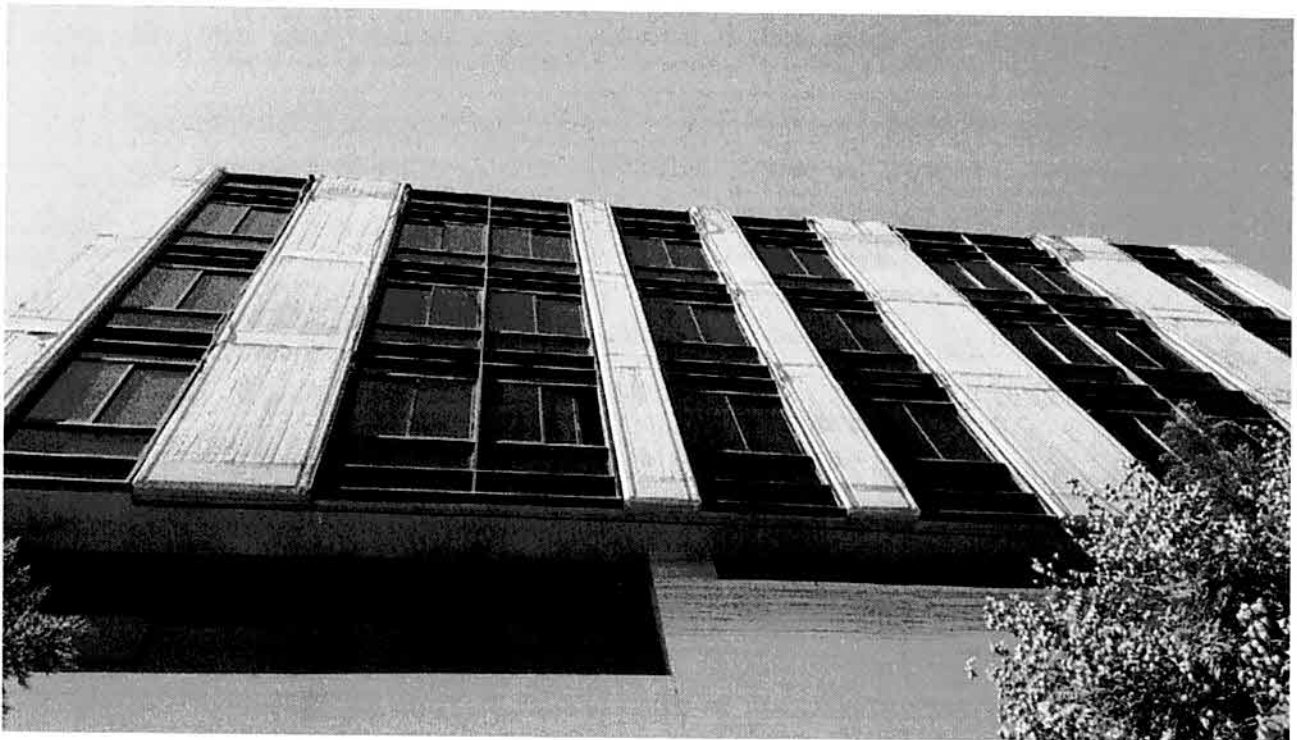
Εικόνα 1: Όψη του Κτιρίου Κ από την οδό Εγνατία με σταθερά και συρόμενα κουφώματα

Στις επόμενες φωτογραφίες παρουσιάζονται ενδεικτικά τα υπόψη κουφώματα.