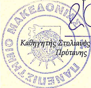
Καθηγητής Στυλιανός Δ. Κατρανίδης Πρότανης

Για τη Διοίκηση της 3ης Υ.Π.Ε. (Μακεδονίας)