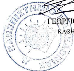
ΓΕΩΡΓΙΟΣ ΒΡΑΝΟΣ ΚΑΘΗΓΗΤΗΣ